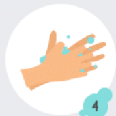
4 Doigts entrelacés