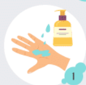
1 Utiliser du savon