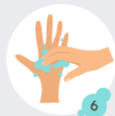
6 Ongles et articulations