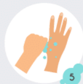
5 Base des pouces