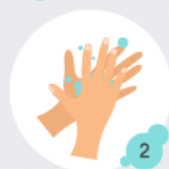
2 Paume contre paume